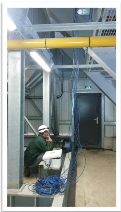
Photo 1 : Des centrales d'acquisition permettent un enregistrement automatique de différents capteurs au cours de l'essai (Audit Silo de Jessains, Vivescia, 2014).

Les performances de séchage sont liées aux conditions lors de l'essai, à savoir les conditions d'air ambiant (température, hygrométrie et pression atmosphérique) et les caractéristiques des grains (teneur en eau et température). Des méthodes de corrections prévues dans la norme permettent d'exprimer les performances de séchage dans des conditions spécifiques de grain et/ou d'air ambiant. Ainsi, des suivis interannuels de performances du séchoir, ou la validation de performances affichées par le constructeur de séchoir sont possibles.