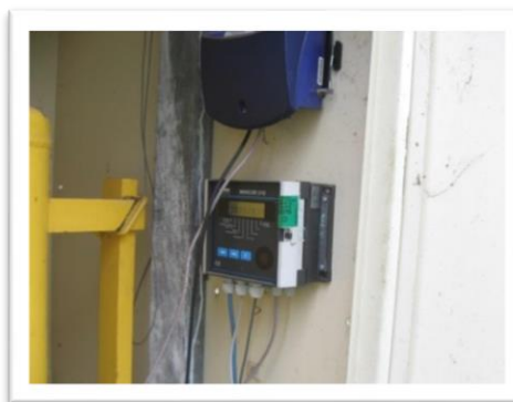
Photo 2 : Grâce à une sonde de température et de pression au niveau de la conduite de gaz, le convertisseur électronique permet de convertir les consommations de gaz en normomètres cubes (en haut, Plateforme Métiers du Grain Boigneville, ARVALIS et en bas, Silo de Jessains, Vivescia).