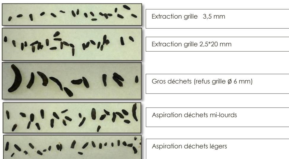
Figure 2 : Photographie des sclérotés dans les différentes fractions de déchets

Cet essai montre qu'au niveau du silo des actions sont possibles pour abaisser de 30 à 50% la teneur en sclérotés d'un lot de blé. Un retraitement des déchets sur un trieur optique est envisageable en complément afin de récupérer les bons grains présents de façon abondante dans les différentes fractions. Une attention toute particulière doit être portée à l'échantillonnage des lots, l'hétérogénéité de la contamination en sclérotés peut être source d'erreur importante de l'estimation des concentrations en ergot.